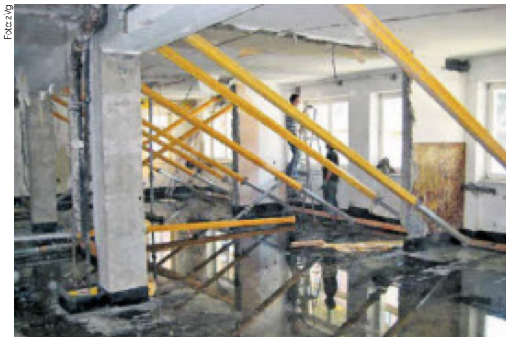
Gerade beim Dachbodenausbau kann es oft zu Wassereintritt kommen