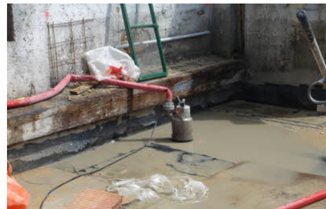
Nur durch eine richtige Abdichtung verhindert man einen Wassereintritt in den darunter liegenden Wohnungen

In den seltensten Fällen ist dem Bauherrn selbst ein Mitverschulden anzulasten, zum Beispiel dann, wenn er sich eine sinnvolle oder notwendige Abdichtung aus Kostengründen erspart hat. Andererseits trifft gerade diesen, vor allem gemäß den §§ 364 ff ABGB eine sehr strenge nämlich eine verschuldensunabhängige nachbarrechtliche Haftung. Das bedeutet, dass der Bauherr mit ei-