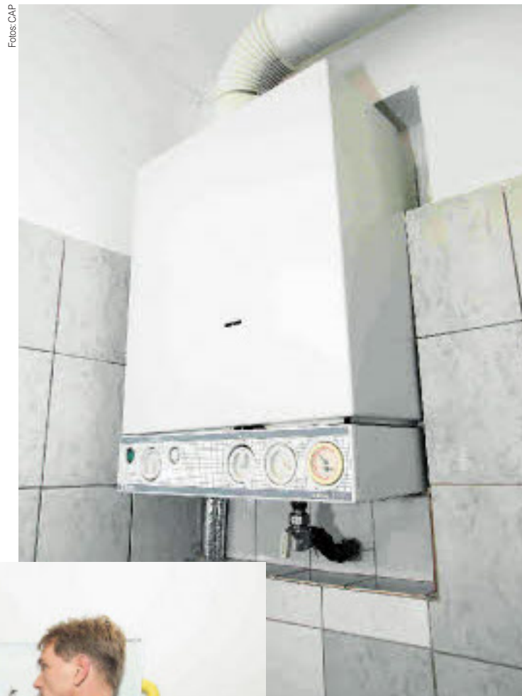
Die Heizsaison steht unmittelbar bevor. Moderne Thermen sparen nicht nur Geld und Emissionen, sondern sind auch sicherer.